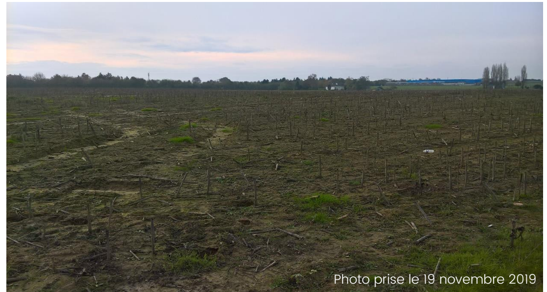
Photo prise le 19 novembre 2019